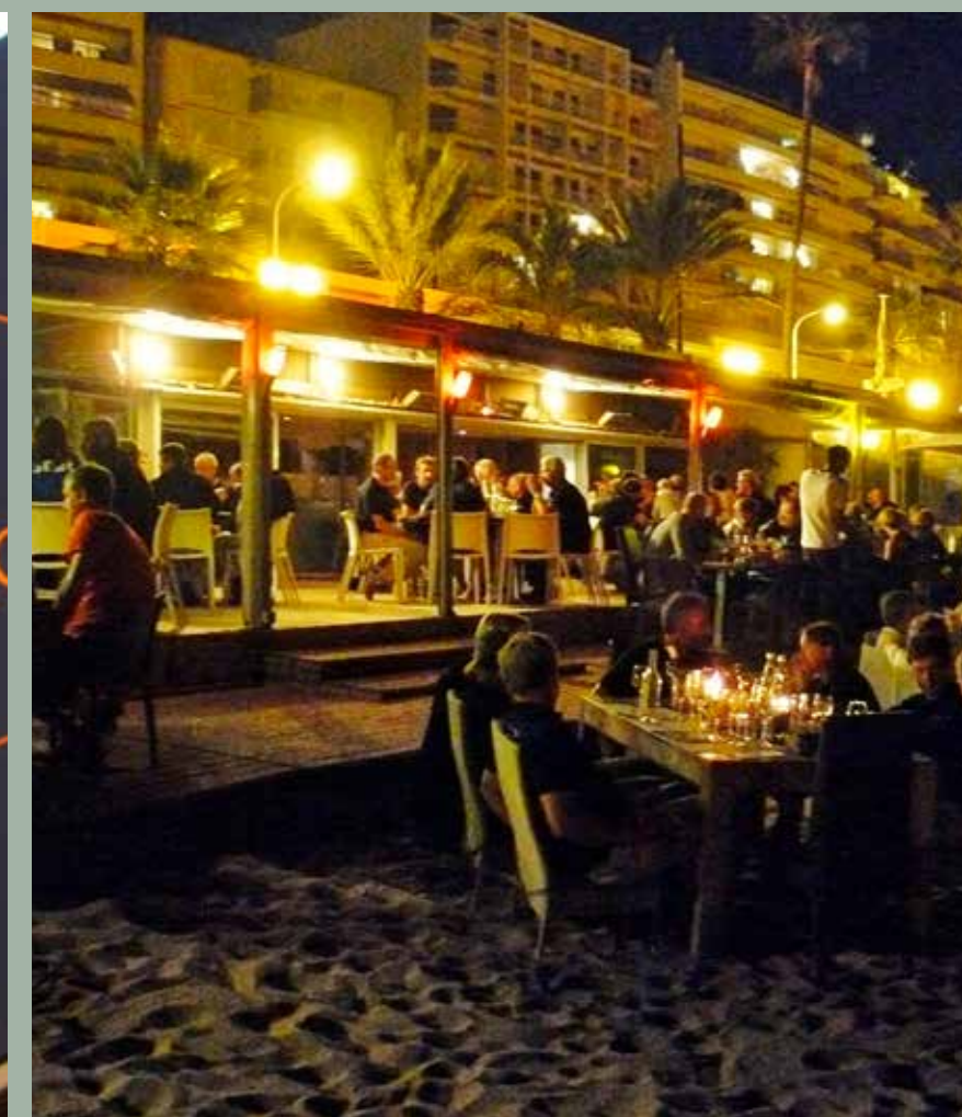
La vita notturna