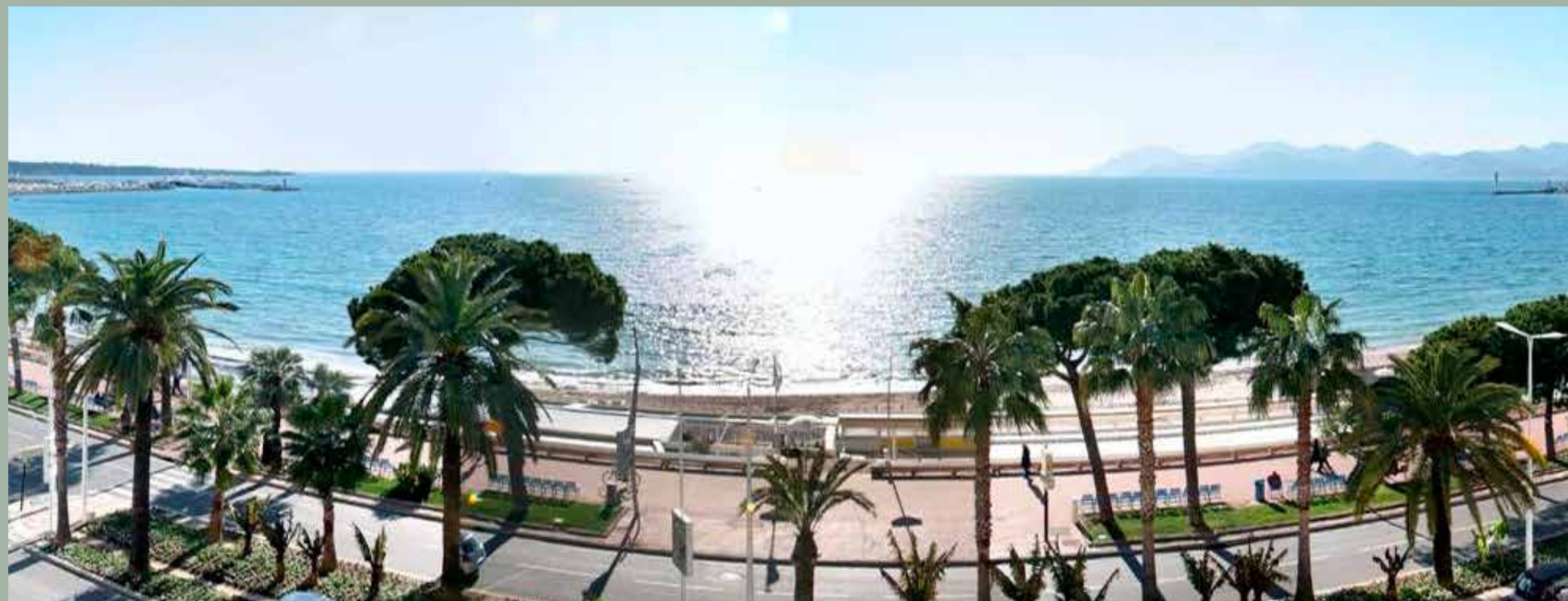
Una panoramica della costa